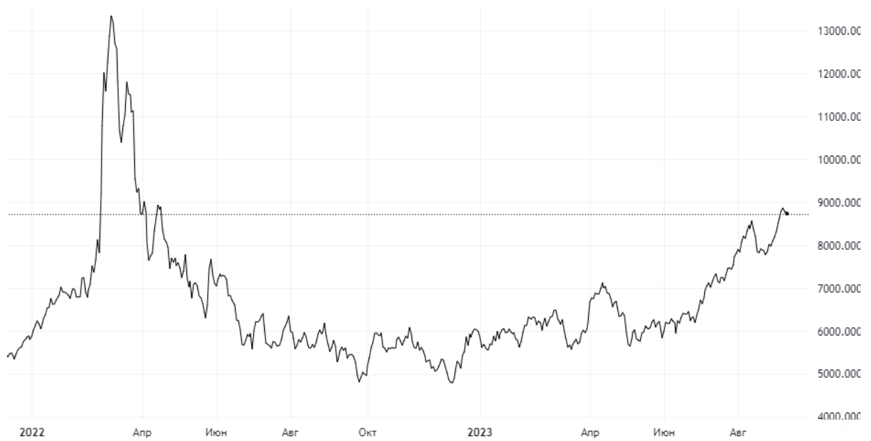
Рисунок 2. Динамика изменения цены нефти марки «Brent» в рублях

Рыночная конъюнктура в секторе нефтедобычи существенно улучшилась за последние месяцы. Причиной этого стал одновременный рост цены на нефть с одновременным ослаблением национальной валюты. Результатом этого стало достижение цены нефти «Brent» отметки в 9000 рублей за баррель, что является высоким значением.