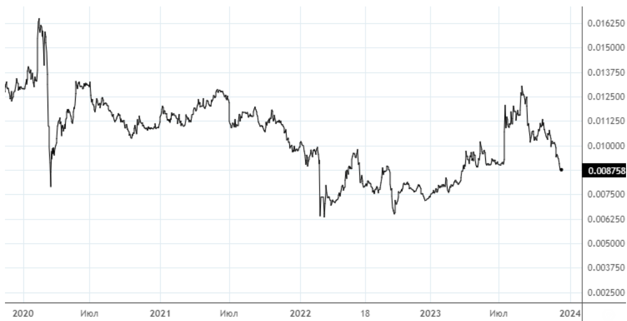
Рисунок 2. Динамика изменения цены акций «ТГК-1»

Бумаги длительное время не могут преодолеть максимумы до начала пандемии коронавируса. Единственным позитивным моментом является «разгон» бумаг летом текущего года на фоне возросших спекуляций в секторе энергетики, после чего бумаги ожидаемо вернулись к исходную точку. Акции «ТГК-1» на наш взгляд, не являются привлекательной инвестиционной идеей по текущим ценам. По мере восстановления прибыли и возвращения к дивидендным выплатам данная ситуация может измениться, за чем мы продолжим следить в следующих материалах по данному эмитенту.