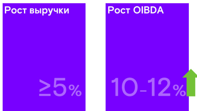
Рисунок 5. Актуальный прогноз ключевых финансовых показателей по итогам 2021 года