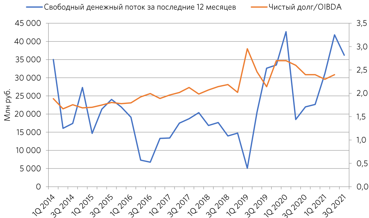
Рисунок 4. Динамика изменения свободного денежного потока за последние 12 месяцев и коэффициента «Чистый долг/EBITDA»

Согласно нашим предположениям, свободный денежный поток достиг уровня, при котором у компании появилась возможность увеличить выплаты акционерам. Коэффициент «Чистый долг/EBITDA» остается в рамках прежних значений. Напомним, что высокая долговая нагрузка является основной проблемой компании на сегодня.