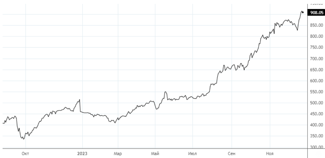
Рисунок 2. Динамика изменения цены акций «Газпром нефть»

Бумаги компании ранее выделялись нами как лучшая инвестиционная идея в секторе и с начала года прибавили около 100%, что увеличивает вероятность существенной технической коррекции. Уровень дивидендной доходности на сегодня выглядит конкурентным, однако вероятность сохранения коэффициента выплат более 50% в будущем остается неопределенной. В случае улучшения финансового состояния материнской компании – «Газпром», необходимость в денежных «вливаниях» от Газпром нефти снизится, что способно стать причиной снижения коэффициента выплат к нижней границе в 50%. Мы считаем, что на сегодня котировки находятся около своих справедливых значений.