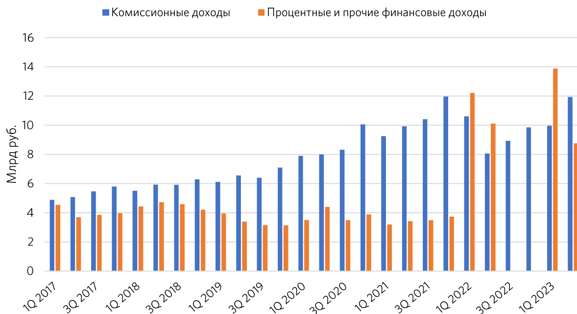
Рисунок 1. Динамика изменения комиссионных и процентных доходов (часть данных за 2022г. отсутствует)

На этой неделе «Московская биржа» представила свои финансовые результаты по международным стандартам за второй квартал и первое полугодие 2023 года. Рассмотрим основные изменения в представленных данных, а также традиционно обновим инвестиционный взгляд на акции эмитента.