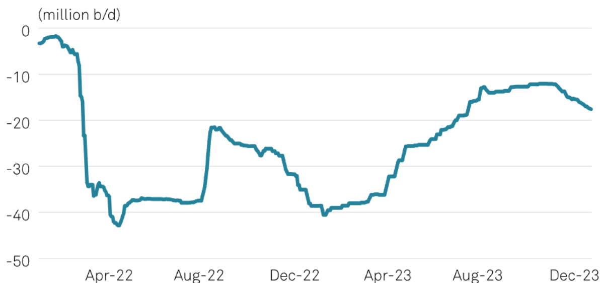
Рисунок 2. Дисконт российской нефти «Urals» к «Brent»

Дисконт российского сорта «Urals» к «Brent» продолжает сокращаться, почти достигнув отметки в -10 USD на баррель. Таким образом, данный показатель сократился более чем вдвое со своих минимумов 2022 года, что позитивно скажется на финансовых результатах нефтедобывающих компаний.