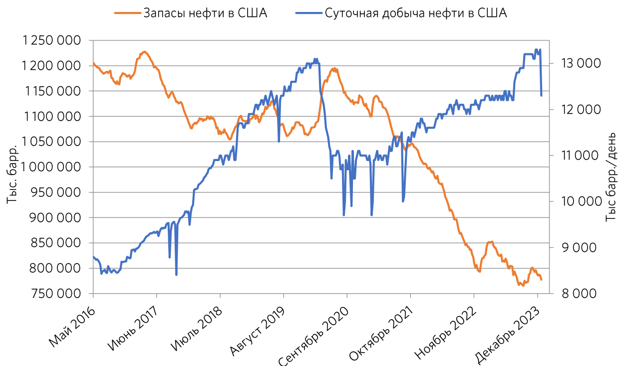
Рисунок 4. Динамика изменения добычи и запасов сырой нефти в США

Ситуация с запасами сырой нефти в США вновь продолжила ухудшаться. Несмотря на публичные планы по пополнению запасов, объем запасов приблизился к минимумам. Помимо этого, в январе произошло резкое падение добычи 1 млн баррелей в сутки из-за резкого похолодания.