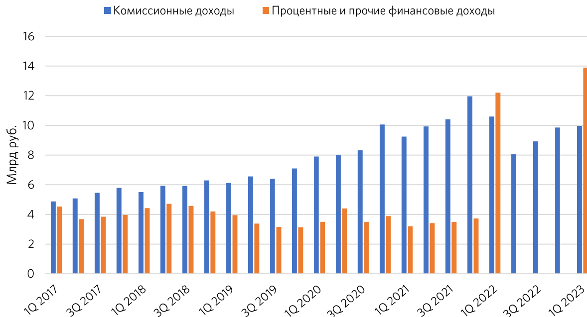
Рисунок 2. Динамика изменения комиссионных и процентных доходов (2-4 кв 2022 нет данных процентных доходов)

Постепенно с восстановлением раскрытия квартальных финансовых отчетов появляются ранее неопубликованные данные по процентным доходам биржи. Скачок процентных и прочих финансовых доходов с 2022 года обусловлен резким ростом денежных остатков на счетах клиентов, ростом процентных ставок в экономике России, а также получением доходов со счетов типа «С», размер которых, согласно заявлениям ЦБ, превышает 280 млрд руб. Однако биржа уже передала упомянутые счета под управление АСВ 1 , что окажет давление на процентные доходы в будущем. Рост процентных доходов в первом квартале 2023 года составил 21% относительно аналогичного периода годом ранее. Комиссионные доходы сократились на 6,5%.