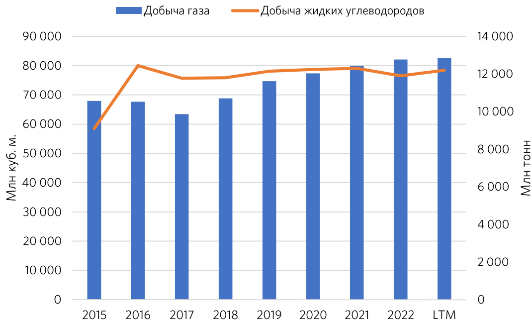
Рисунок 2. Динамика изменения добычи газа и жидких углеводородов

Операционные результаты, опираясь на динамику последних двенадцати месяцев (LTM), демонстрируют положительную динамику. «Новатэк» продолжает постепенно наращивать свои производственные мощности.