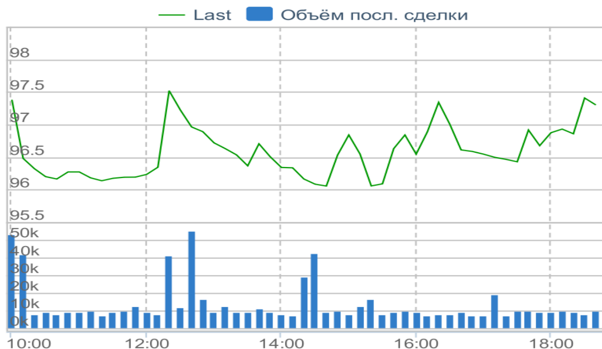
Рисунок 2. Динамика цен акций «Детского Мира» 2 июня.

В итоге, до самой первой новости об иске цена составляла 22,29 руб. (закрытие 2 мая), с тех пор она уменьшилась на 40%, что эквивалентно почти 85 млрд. руб. Эта сумма равна почти половине от текущих требований по иску. Т.е. участники торгов полагают, что при проигрыше АФК «Система» в суде не вся сумма будет выплачена ей напрямую. Частично средства будут «выкачены» из дочек за счет увеличения их дивидендных выплат. Поэтому заявление Игоря Сечина положительно повлияло и на акции «МТС», а также «Детского Мира».