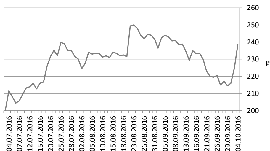
Рисунок 1. Динамика стоимости РДР Русала на Московской Бирже

Среди самых заметных изменений на бирже в Москве стоит отметить, увеличение стоимости Русала.