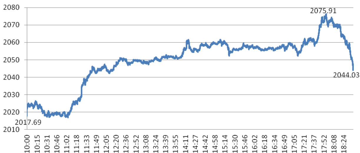
Рисунок 1. Динамика индекса ММВБ 10 ноября

Рублевый индекс ММВБ, один из основных российских фондовых индикаторов, вечером в четверг обновил исторический максимум, превысив 2070 пунктов на фоне общемирового подъема после победы республиканца Дональда Трампа на президентских выборах в США.