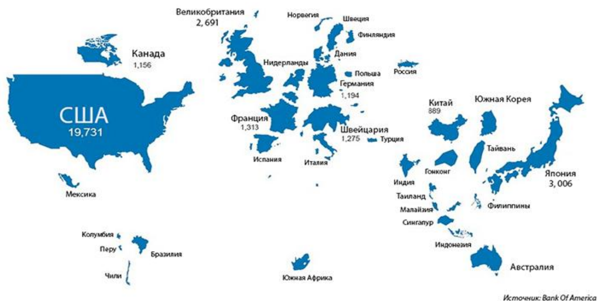
Карта мира в зависимости от объема фондового рынка, капитализация указана в $млн: