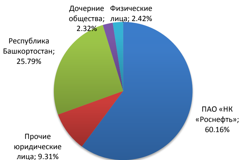
Рисунок 1. Структура акционерного капитала ПАО "Башнефть"

В соответствии с законодательством РФ ПАО «НК «Роснефть» направило 15.11.2016 в ПАО АНК «Башнефть» обязательное предложение о приобретении 55 466 137 обыкновенных акций ПАО АНК «Башнефть», составляющих 37,52% общего количества обыкновенных акций ПАО АНК «Башнефть». Ранее обязательное предложение было рассмотрено Банком России. Предлагаемая цена приобретаемых ценных бумаг составляет 3 706,41 руб. за одну обыкновенную именную акцию ПАО АНК «Башнефть» (данная стоимость соответствует параметрам договора купли-продажи государственного пакета акций «Башнефти»).