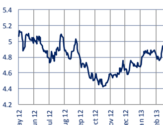
Moody's Bond Indices Corporate BAA