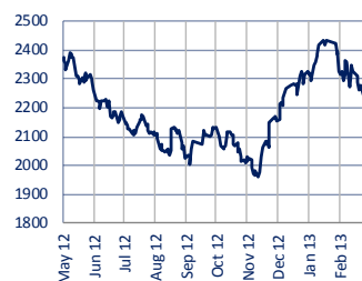
Shanghai SE Composite