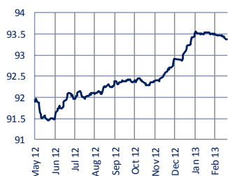
ММВБ, корп. облигации, ср.взв.цена