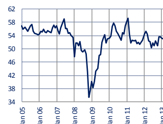
JPM Global Composite PMI SA