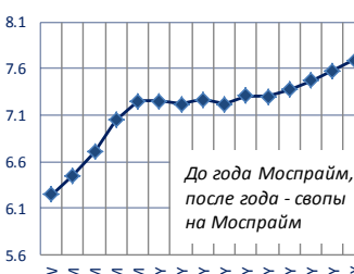
Ставки денежного рынка в РФ