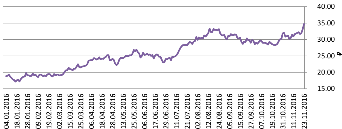
Рисунок 2. Динамика цены акций ОАО «Магнитогорский металлургический комбинат»

Максимальный рост среди членов индекса ММВБ показали акции ОАО «Магнитогорский металлургический комбинат», а ПАО «Северсталь» обновила рекорд на оптимизме относительно роста спроса в Китае и программы стимулов в США.