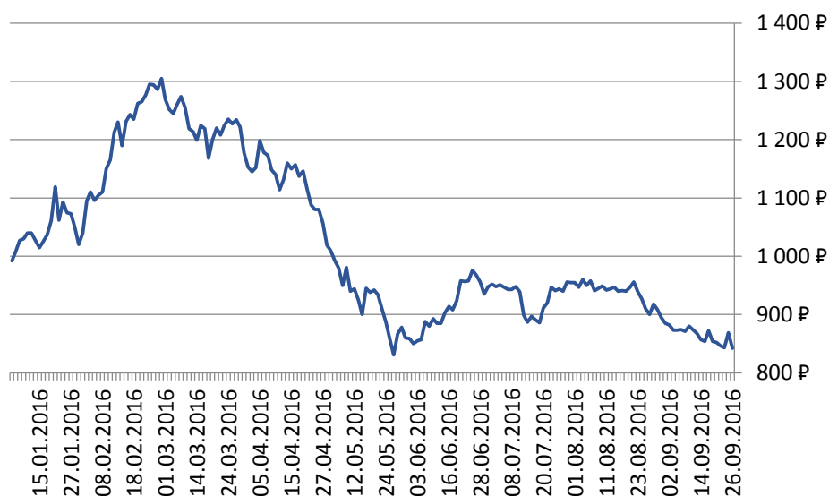
Рисунок 2. Динамика цена на депозитарные расписки РОС АГРО

Стоимость депозитарной расписки в последнее время падает. Так, в начале года цена была больше 1000 ₽ (максимальное значение – 1305 ₽). Однако, с начала марта до конца мая было резкое падение. Его можно связать с сообщениями о допэмиссии, в ходе которой компания привлекла 250 млн. $.