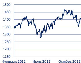
Индекс S&P 500