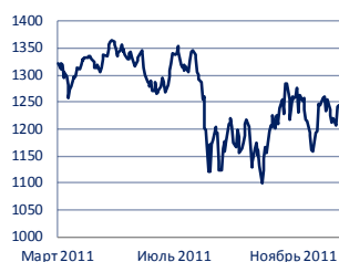
Индекс S&P 500