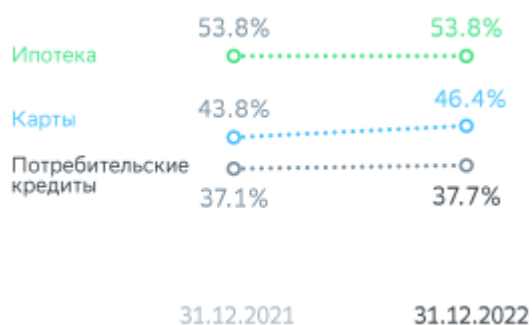
Рисунок 3. Изменение доли на рынке РФ по сервисам, предназначенным для физлиц

Размер кредитного портфеля вырос на 12,8%. Размер кредитов, выданных юрлицам, увеличился на 13,2%. Кредиты, выданные физлицам, выросли на 12,2%.