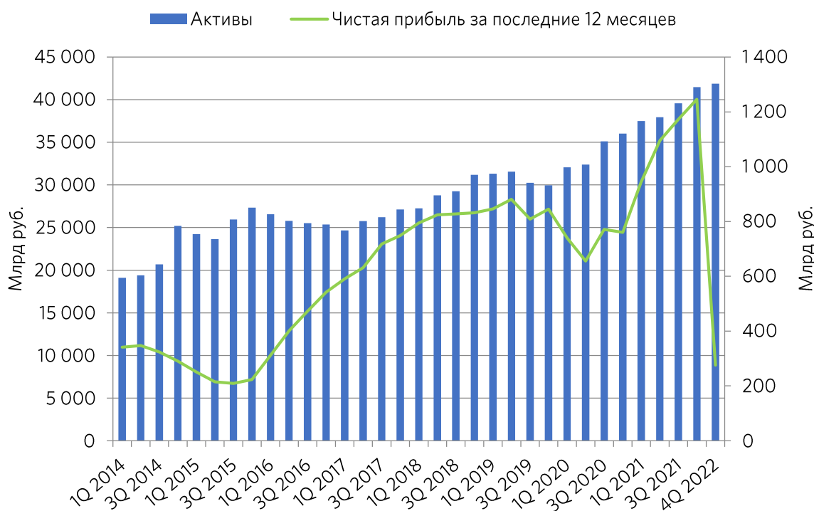
Рисунок 1. Динамика изменения размера активов и чистой прибыли за последние 12 месяцев

Продолжаем знакомиться с финансовыми результатами за 2022 год эмитентов, возобновивших публикацию обновленных данных. Сегодня обратим внимание на «Сбер», отчитавшийся на этой неделе. Кратко обратим внимание на основные изменения, а также традиционно обновим инвестиционный взгляд на акции.