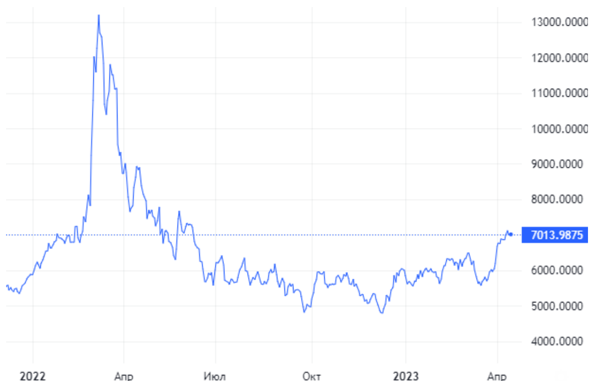
Рисунок 2. Динамика изменения цены нефти марки «Brent» в рублях

Цена нефти «Brent» в рублях продолжает восстановление после минимума в конце прошлого года. Этому в значительной степени способствует ослабление рубля, который с начала года теряет около 20%. Размер дисконта «Urals» к «Brent» по разным направлениям составляет от 30 USD на баррель до 12 USD на баррель (Индия).