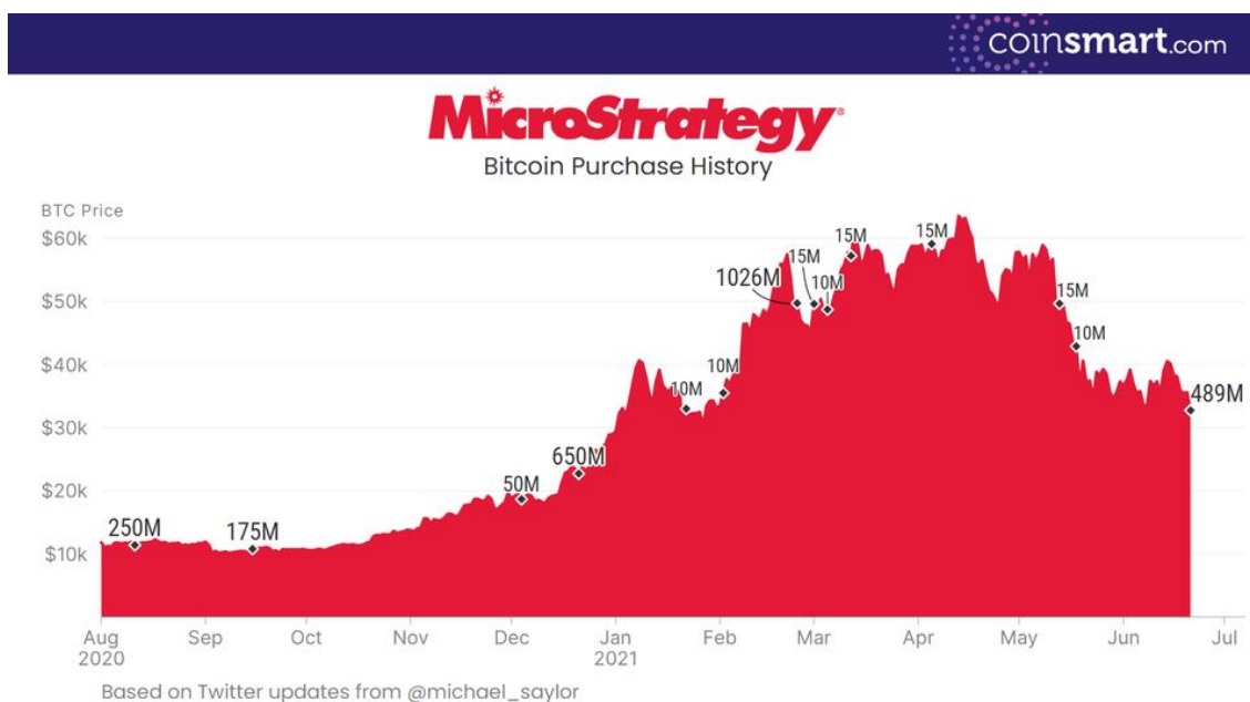
Рисунок 1. История покупок биткойна компанией «MicroStrategy»

В ожидании финансовых результатов за второй квартал и первое полугодие 2021 года российских эмитентов предлагаем вернуться к бумагам иностранных эмитентов, обращающихся на Московской бирже. Вновь обратим внимание на компанию, связанную со сферой криптовалют – «MicroStrategy». Данная компания длительное время занималась работой с мобильным программным обеспечением, облачными сервисами и предоставляла бизнес-аналитику, однако в прошлом году внезапно начала активно скупать биткойн, чем привлекла к себе значительное внимание.