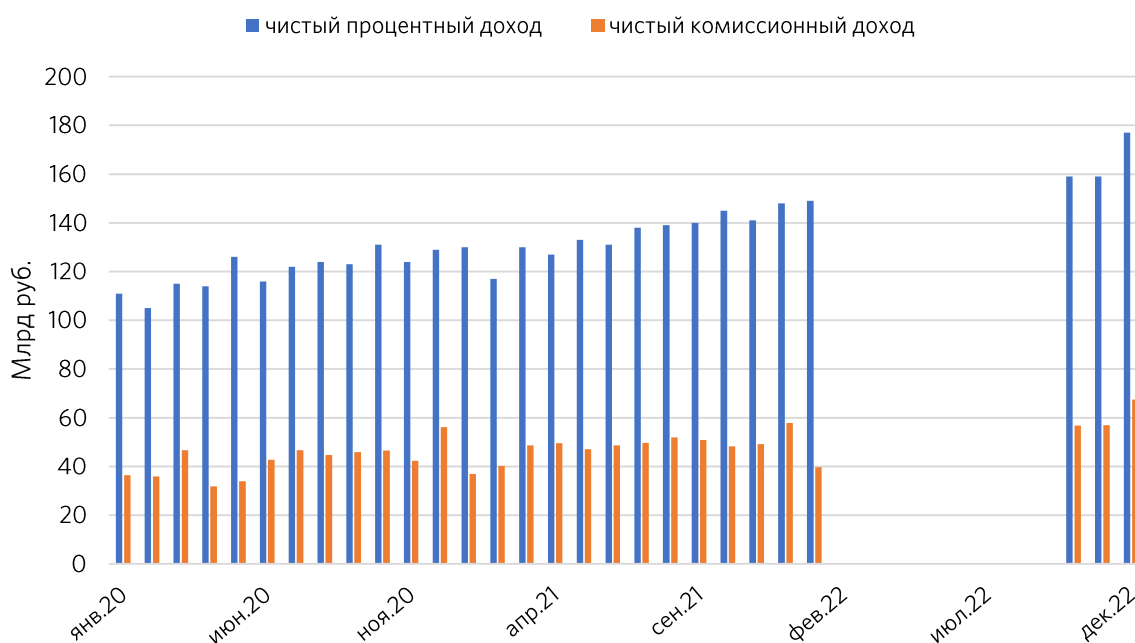
Рисунок 1. Динамика изменения чистых комиссионных и процентных доходов (данные с февраля по сентябрь 2022 года включительно отсутствуют)

Количество активных клиентов-физических лиц выросло на 2,9 млн чел. с начала года до 106,7 млн чел. Объем кредитного портфеля по физлицам с начала года вырос на 12,9%. Главным драйвером данного изменения стало сохранение и расширение ипотечных программ. Кредитный портфель по юрлицам прибавил 12,4%. Средства юрлиц на счетах за год сократились на 0,7%. Средства физлиц выросли на 8,2% с введением выгодных сезонных предложений и привлекательных условий для подписчиков СберПрайм+, а также зарплатных клиентов.