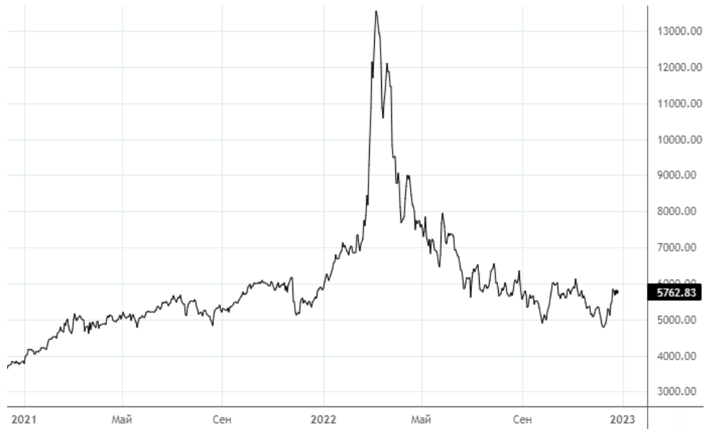
Рисунок 2. Динамика изменения цены нефти марки «Brent» в рублях

Цена на нефть марки «Brent» в рублях сохраняет околонеutralную динамику. В последнюю неделю заметен рост, отражая изменения валютного курса. Дисконт российской нефти «Urals» к мировому аналогу «Brent» остается выше отметки в 20 USD на баррель.