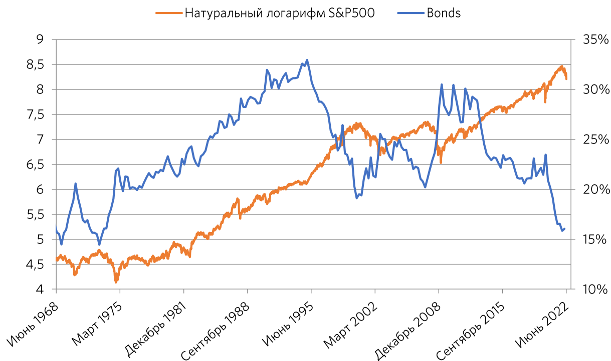
Рисунок 2. Облигации в структуре активов д/х в США

Физические лица снижают долю владения облигациями в последние 20 лет, отражая тренд изменения процентных ставок. Снижение цен облигаций сокращает их общую долю в структуре активов.